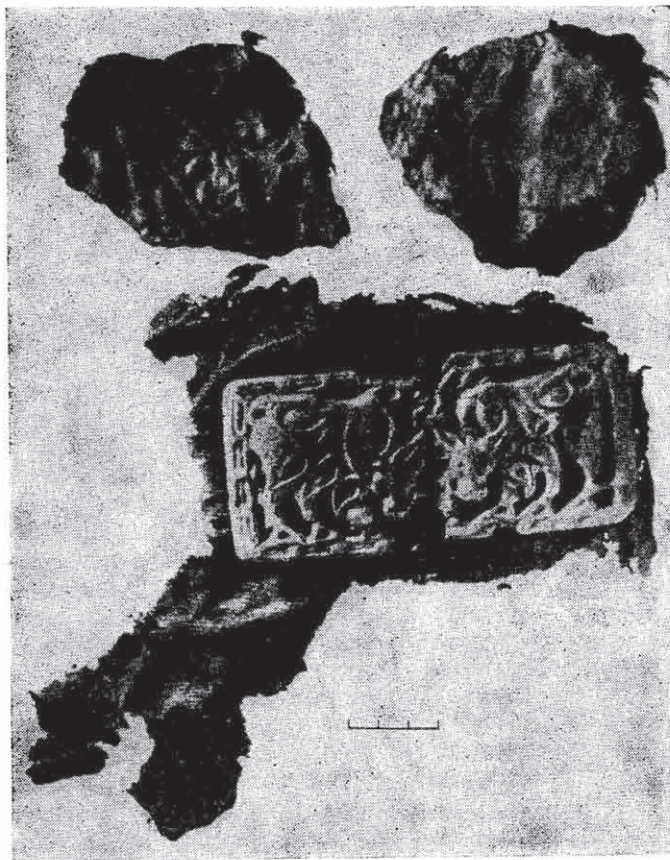
Рис. 1. Поясная пластина, ремень, фрагменты одежды и шкуры из кургана 5 на оз. Утинка

ны по продольной оси пластины и служат для прикрепления к ремню. На ремне в месте прикрепления пластины имелись два отверстия. В них продевался конец узкого ремешка таким образом, чтобы он обвивал перемычку. На обратной стороне ремня-основы делался узел, затем свободный конец ремешка продевался в другую пару отверстий и аналогичным образом связывал ремень со второй перемычкой (рис. 2). Очевидно, так же крепились и другие пластины, поскольку специальных приспособлений в виде петелек или скобок у них нет. Способ крепления за прорези, имеющиеся в ажурном узор рисунка, предполагает А. В. Давыдова 4 .